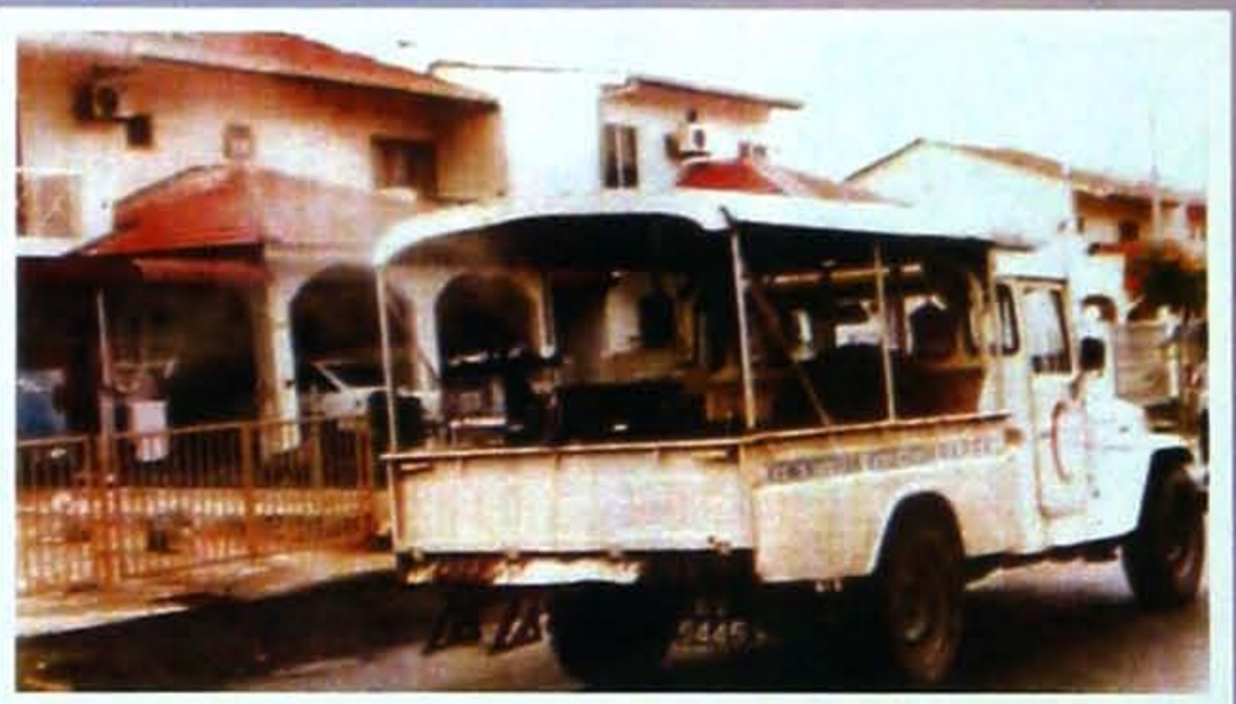
Semburan kabus "Ultra Low Volume (ULV)"