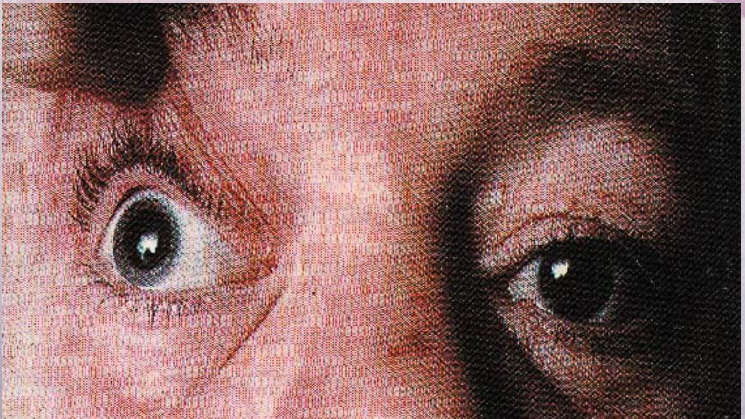
▼ Gangguan saraf otak ketiga (Third Nerve Palsy)