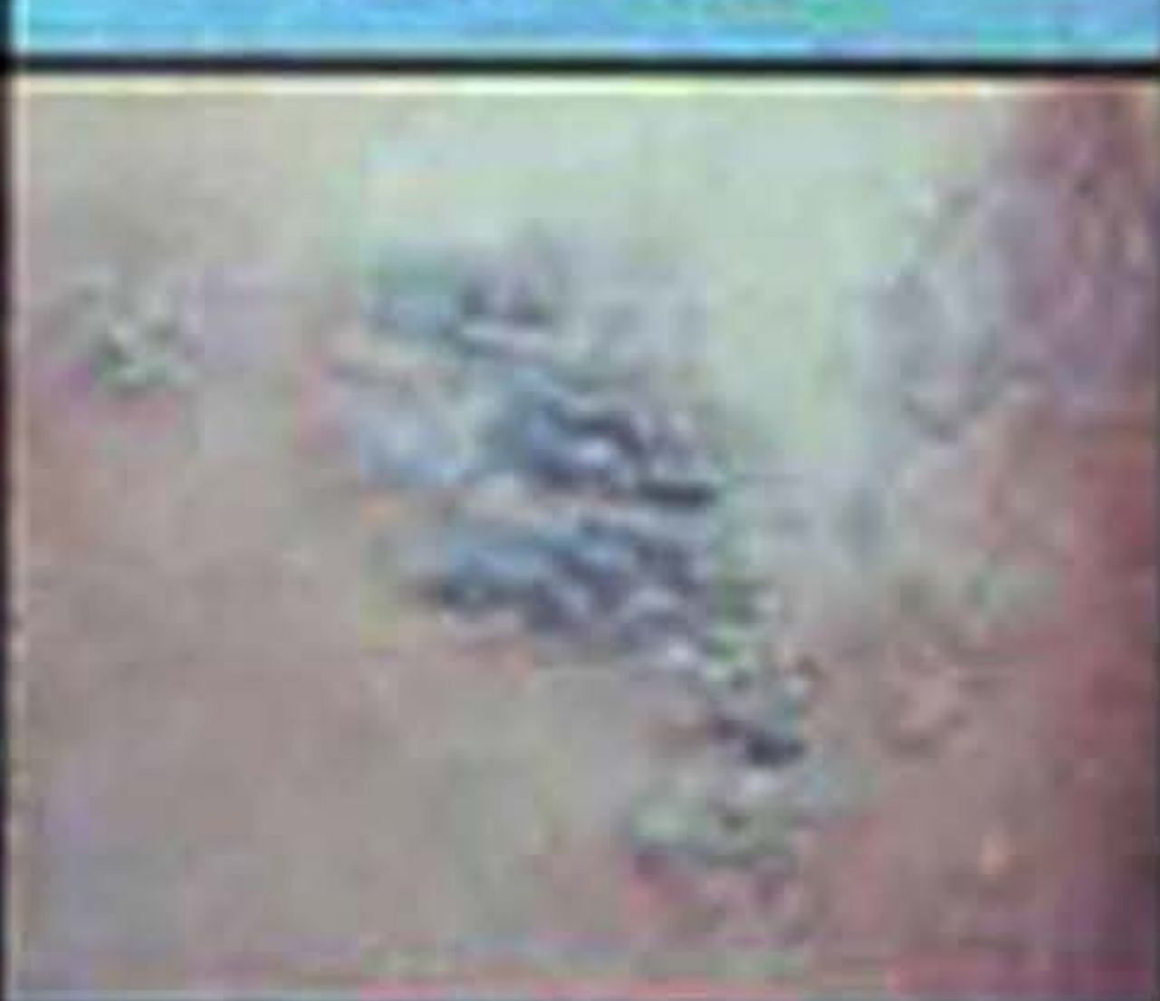
Herpes zoster (sejenis penyakit jangkitan virus)