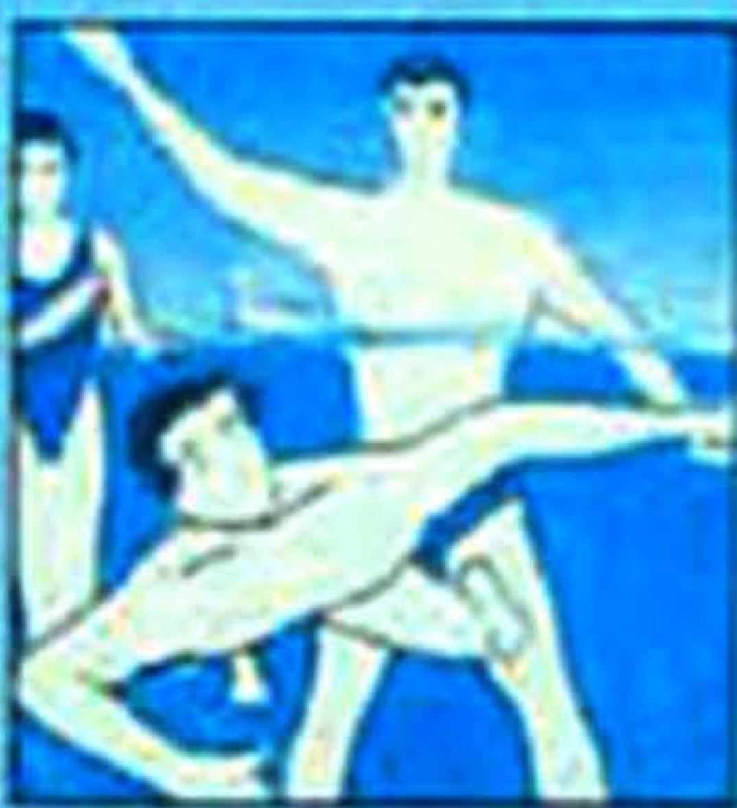
Mandi di kolam renang