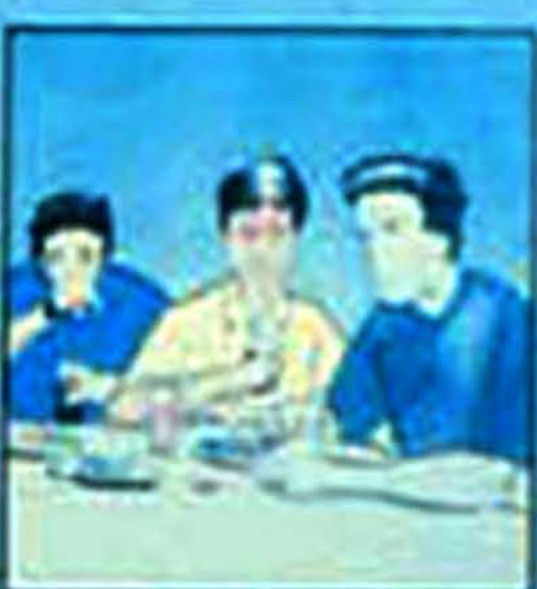
Makanan dan minuman yang disediakan oleh pesakit AIDS