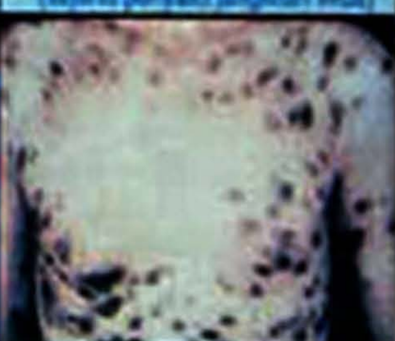
Kaposi's Sarcoma (sejenis bentuk kulit)