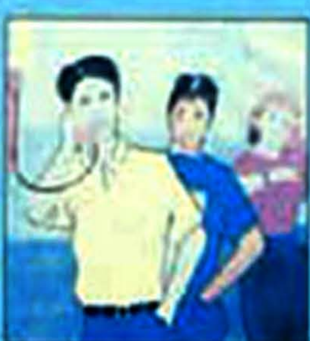
Berkingki ke tandas; semua seperti toilet dan tandas