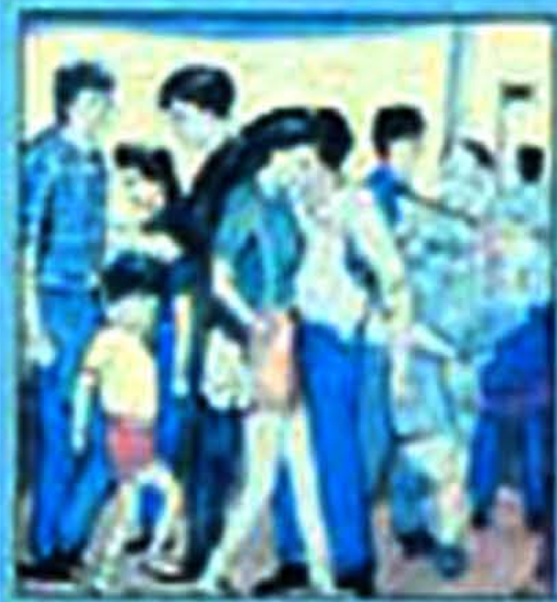
Bertinmpit-binmpit di tempat awam