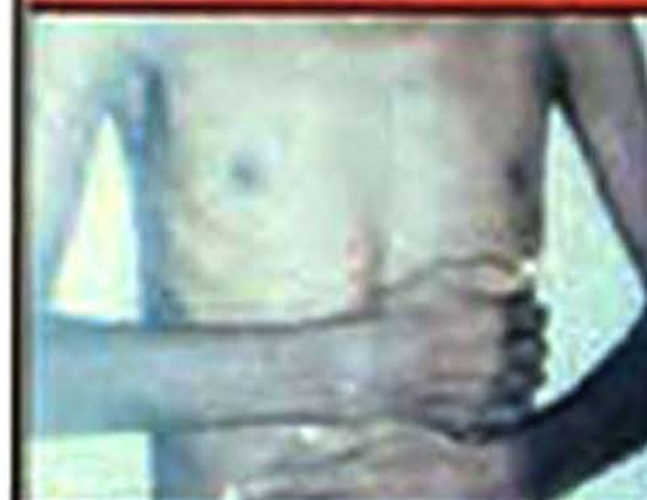
Suatu jenis bintul