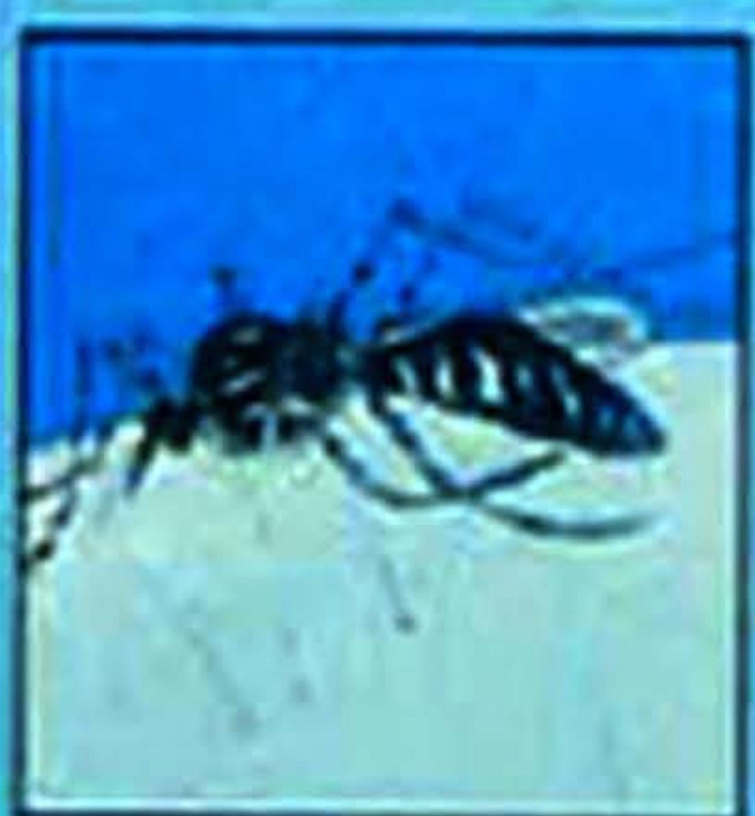
Gigitan serangga seperti nyamuk