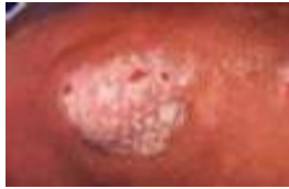
Plaque psoriasis (bertompok dan timbul)