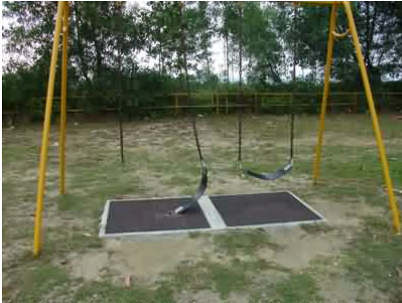
Contoh kawasan permainan yang bahaya