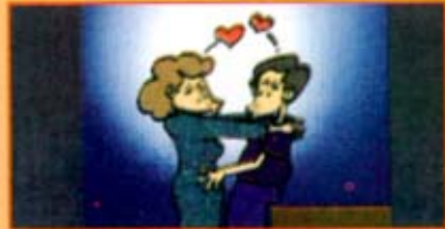
Hubungan seks berlainan jantina atau sejenis