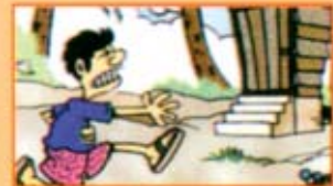
Cirit-birit yang berlarutan