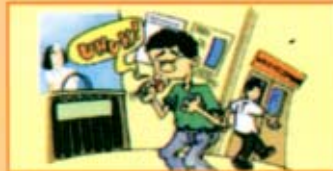
Batuk yang berterusan

Beberapa tahun selepas dijangkiti, pembawa HIV mungkin mengalami beberapa masalah kesihatan seperti berikut: