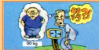
Susut berat badan