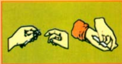
Berkongsi jarum suntikan

Seperti pembawa HIV yang lain, penagih dadah yang dijangkiti HIV boleh memindahkan virus ini melalui 3 cara utama: