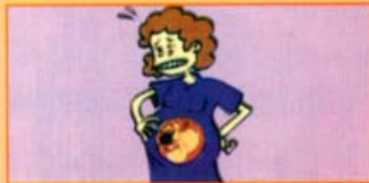
Daripada ibu kepada anak dalam kandungan

* Virus juga dipindahkan melalui pemindahan darah yang tercemar dan melalui penyusuan ibu.