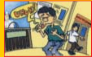
Batuk yang berterusan

Beberapa tahun selepas dijangkiti, pembawa HIV mungkin mengalami beberapa masalah kesihatan seperti berikut :