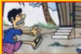
Cirit-birit yang berlarutan