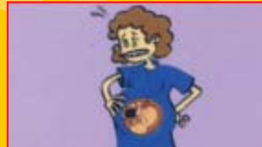
Daripada ibu kepada anak dalam kandungan

* Virus juga dipindahkan melalui pemindahan darah yang tercemar dan melalui penyusuan ibu