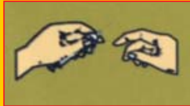
Berkongsi jarum suntikan

Seperti pembawa HIV yang lain, penagih dadah yang dijangkiti HIV boleh memindahkan virus ini melalui 3 cara utama: