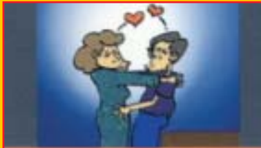
Hubungan seks berlainan jantina atau sejenis