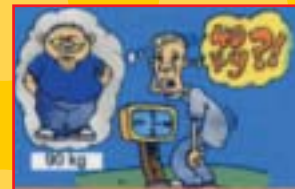
Susut berat badan