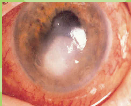
Ulser / Kudis kornea