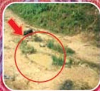
Tempat pembiakan nyamuk Anopheles

Objektif utama aktiviti kawalan malaria adalah untuk mengurangkan kadar dan bilangan kes malaria.