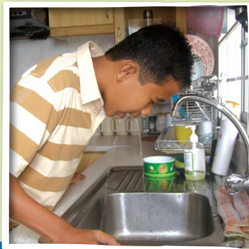
Loya dan muntah