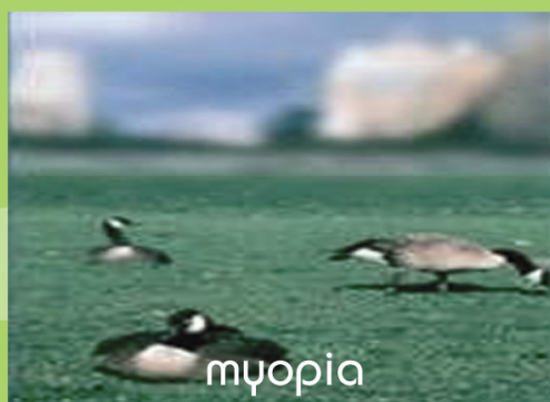
Objek jauh kelihatan kabur