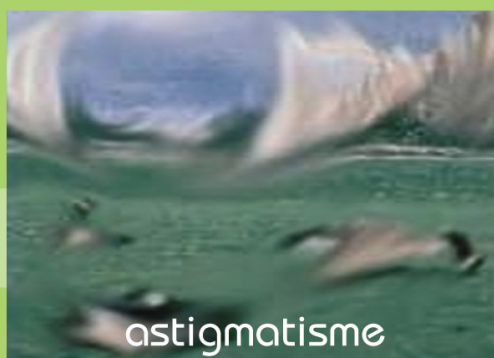
Objek kelihatan kabur dan herot benyot