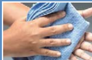
7. Keringkan tangan dengan kain bersih atau tisu