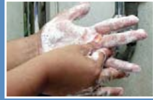
3. Gosok setiap jari dan celah jari