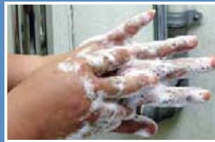
5. Gosok belakang tangan dan celah jari