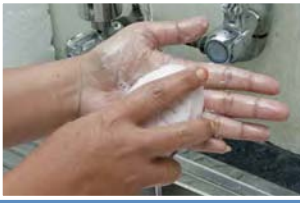
1. Basahkan tangan dan ratakan sabun dengan sempurna