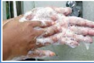
2. Gosok kedua-dua tapak tangan