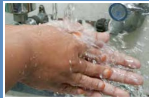
6. Basuh tangan dengan air bersih secukupnya