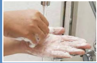
4. Gosok kuku di tapak tangan