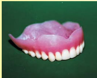
Dentur penuh (Gigi atas)