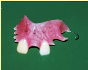
Dentur separa (Gigi atas)