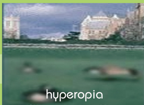
Objek dekat kelihatan kabur