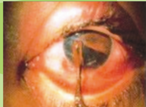
Luka Kornea dengan iris terkeluar