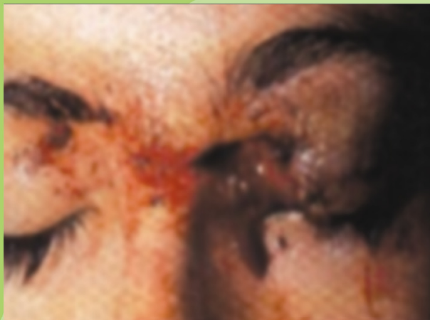
Luka Kelopak Mata