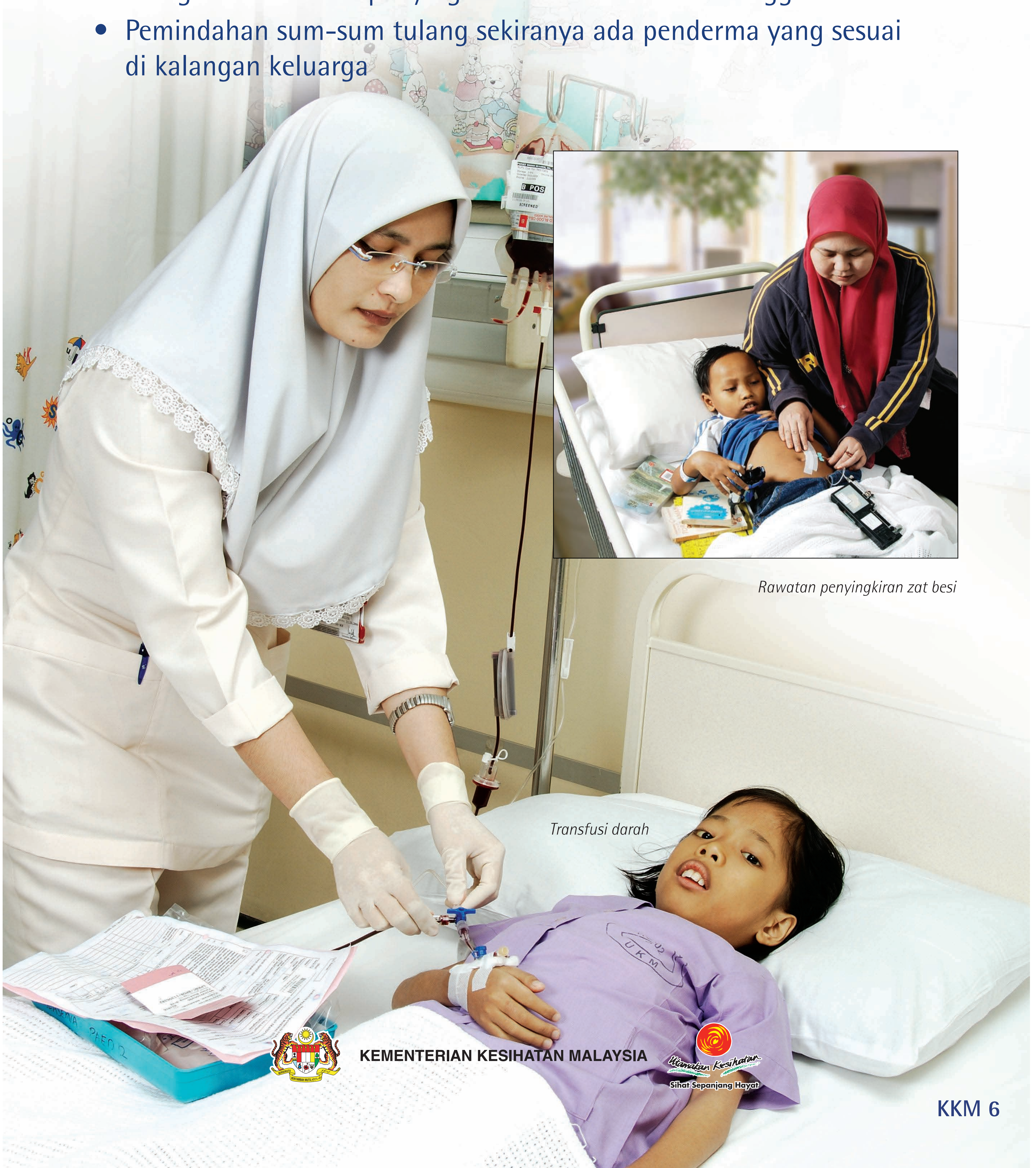
Rawatan penyingkiran zat besi