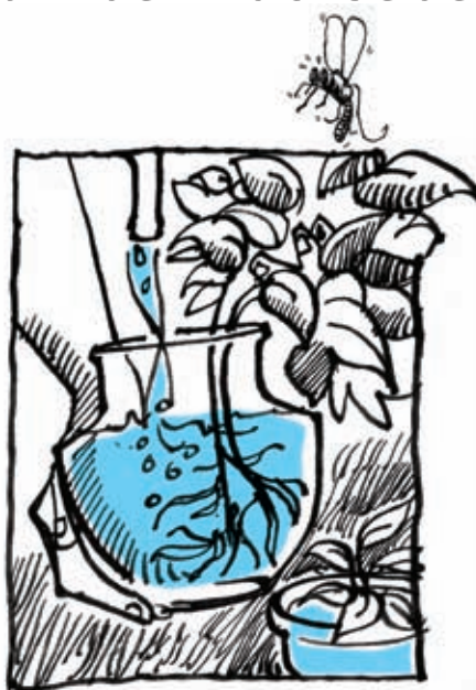
Tukar air dan sental sehingga bersih pasu bunga sebelum dan selepas balik kampung.