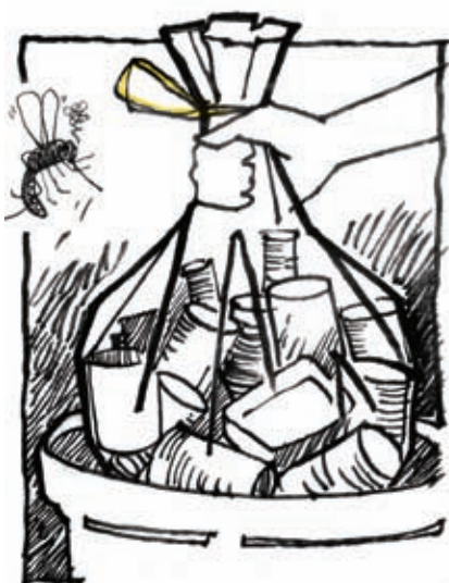
Buang semua bekas terpakai yang boleh menakung air, dengan betul.

Ambil langkah-langkah pencegahan berikut sebelum dan selepas balik kampung: