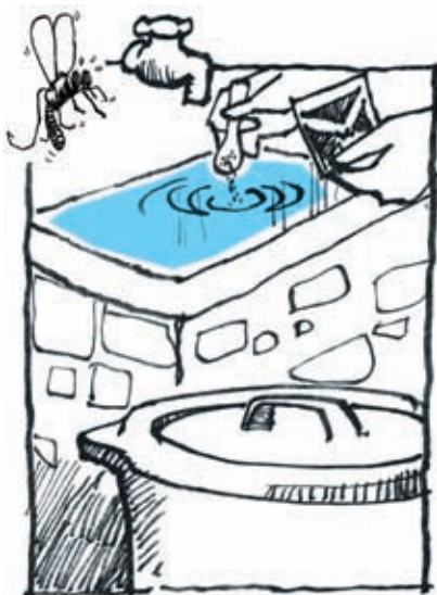
Tutup semua bekas menyimpan air, ATAU masukkan bahan pembunuh jentik-jentik (temephos) mengikut sukatan yang disyorkan pada label.