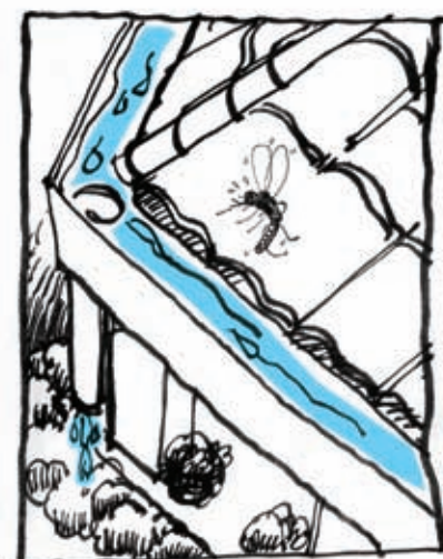
Periksa palong hujan untuk memastikan air tidak bertakung.

Salam Aidilfitri daripada Kementerian Kesihatan Malaysia