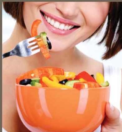
Makan Secara Sihat