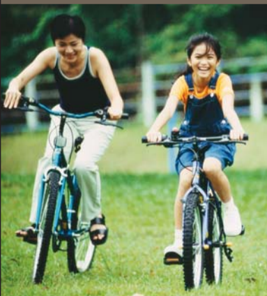
Lakukan Aktiviti Fizikal

CEGAH SEBELUM TERLAMBAT! Amalkan Gaya Hidup Sihat