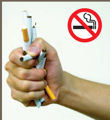
Tak Nak Merokok!