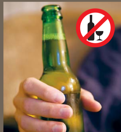
Sihat Tanpa Alkohol