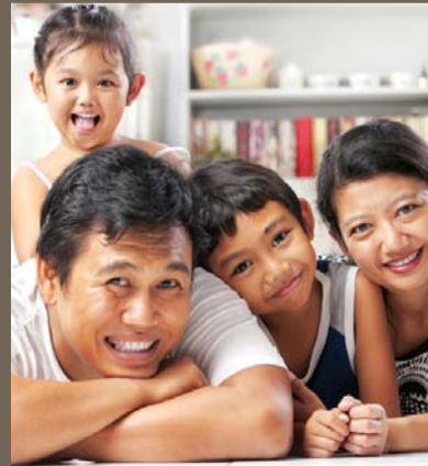
ஆரோக்கியமான மனநலத்தை வளர்த்துக் கொள்ளுங்கள்