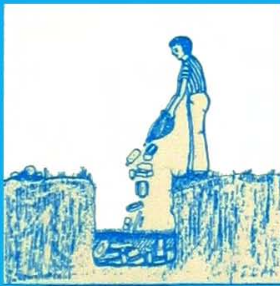
Bersihkan kawasan rumah dan tanam bekas-bekas air yang tidak dipakai SEMINGGU SEKALI