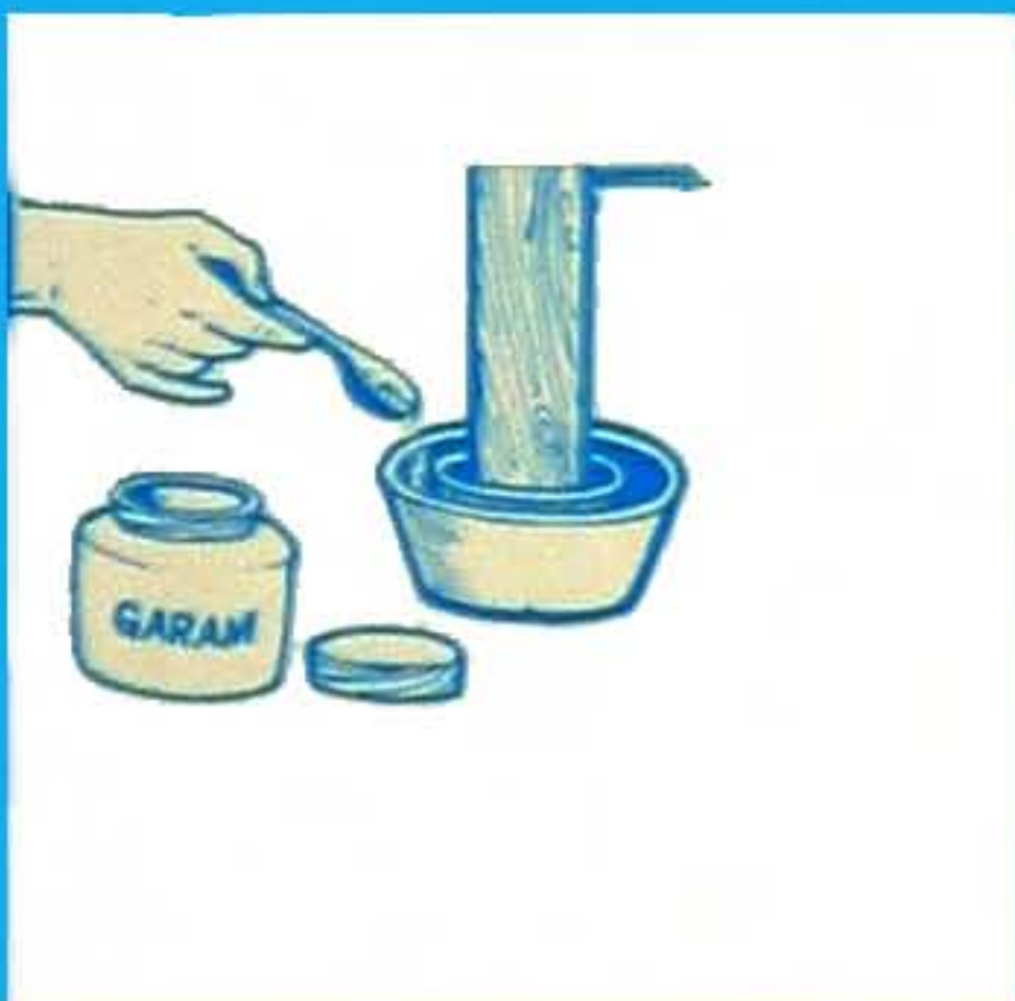
Masukkan garam ke dalam perangkap semut