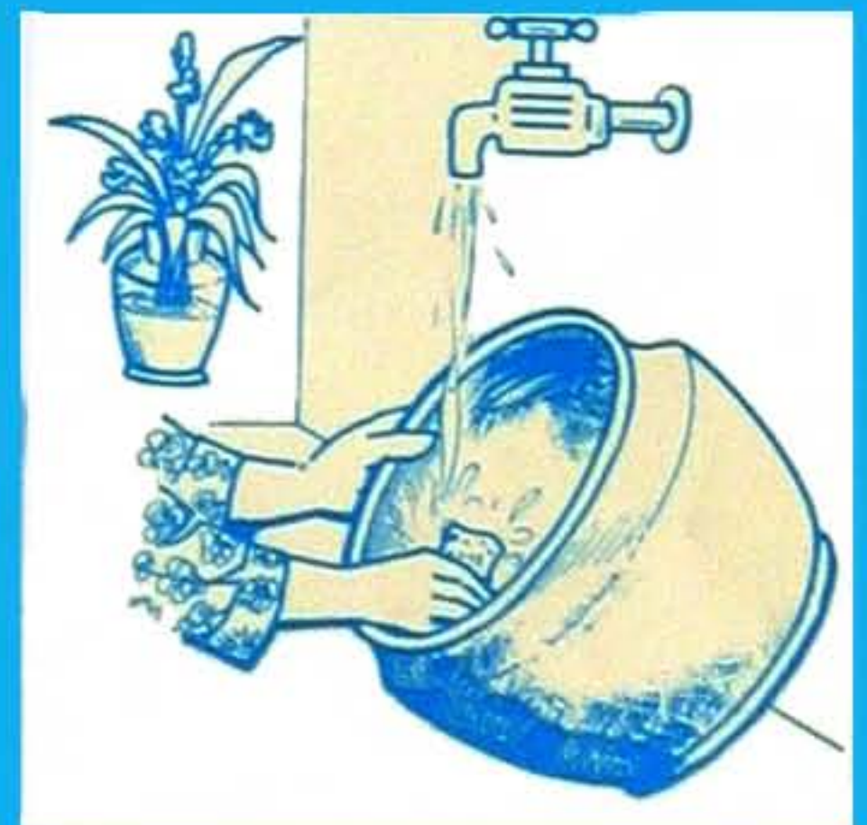
Kosongkan dan berus dalam bekas-bekas mengandungi air SEMINGGU SEKALI