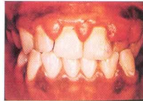
Gusi bengkak dan berdarah semasa mengandung