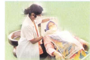
Ambil peluang untuk mendapatkan rawatan pergigian percuma di klinik pergigian kerajaan

Ibu-ibu mengandung digalakkan membuat lawatan awal ke klinik pergigian untuk mengatasi sebarang masalah pergigian. Anggota pergigian sentiasa bersedia untuk memberi nasihat mengenai penjagaan gigi bayi anda.