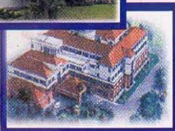
Universiti Sains Malaysia