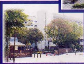
Universiti Kebangsaan Malaysia